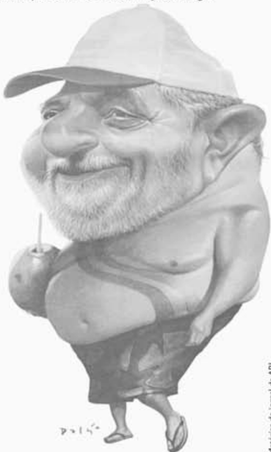
Matérias do Jornal da ABI