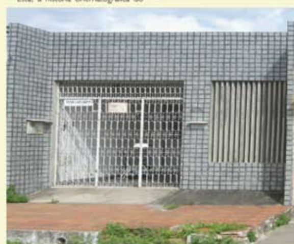
Velha casa de espetáculos da Avenida, 10, nº 1674 (Leonel Leite)

bairro pioneiro em cinema falado para o espectador natalense. Uma história que falta ser completada: quando algum cineasta se interessar em documentar a paisagem humana e sócio-cultural das suas feiras, da vida no centro comercial, dos tipos humanos, dos variados tipos de habitações, das suas festas (profanas e religiosas), até mesmo da forma de agir dos seus marginais — em fim, da psicologia e filosofia de vida de um povo que mescla raças e simboliza estratos sociais dos mais simples.